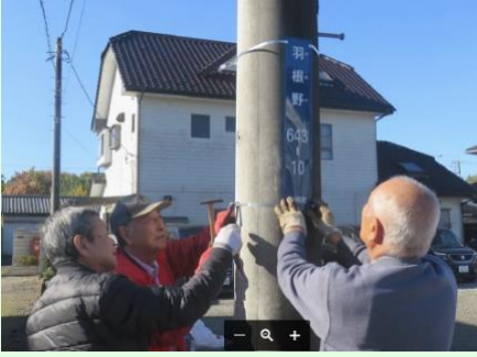
羽根野 800-28 利根町

最近、増加している児童犯罪発生時、交通事故時、徘徊老人対策、火災等の緊急時等で、自分の立ち位置を的確に把握し、通報することができるよう、利根町住民の安全対策としての効果が期待されます。なお、今年度は132箇所に設置します。