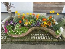
コミュ・ガーデン No.3 (自治会防 災倉庫前)