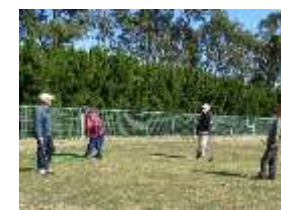
グラウンド・ゴルフ 浄化センター 2/24 及び 2/28