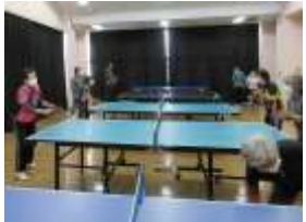
卓球 文化センター 3/6 及び 3/13

発行日 令和3年3月20日 発行 とねワイワイくらぶ 住所: 利根町下曾根321 電話: 090-1407-4480 FAX: 0297-68-3812 責任者 会長 出口博 編集 広報担当